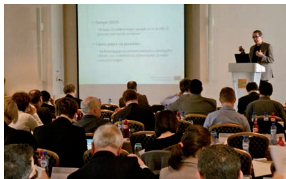
asisp Netzwerktreffen 2011

dem neben den Expert(inn)en aus den 34 europäischen asisp Ländern auch zahlreiche Mitarbeiter(innen) der Europäischen Kommission und Vertreter(innen) des Ausschusses für Sozialschutz teilnahmen. Im Fokus des Treffens stand die soziale Dimension der europäischen Strategie 2020 sowie der Beitrag der sozialen Sicherungssysteme zur Armutsvermeidung.