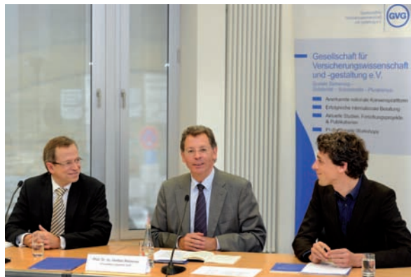
Pressekonferenz zur Vorstellung des Bandes 69 der GVG Schriftenreihe

Im Rahmen der GVG-Schriftenreihe ist als Band 69 eine Publikation unter dem Titel „Umgang mit dem Fachkräftemangel in der Pflege“, Teil I, Deutschland, erschienen. Neben einer Darstellung der erwarteten Entwicklung der Zahl Pflegebedürftiger und von Pflegekräften werden unter anderem Ursachen für den Fachkräftemangel sowie die Ausbildungssituation in den Pflegeberufen beleuchtet. Aus dem analytischen Teil abgeleitete Empfehlungen runden das Werk ab. Die internationale Dimension des Themas wird in einem Teil II, als Band 70 der GVG Schriftenreihe, im Nachgang des Euroforums veröffentlicht.