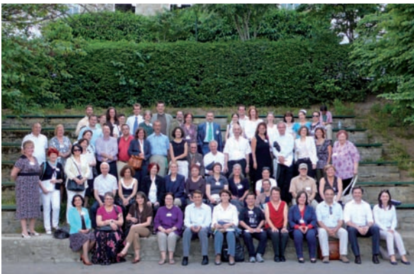
Treffen des GVG Forschungsteams an der Bogazici-Universität, Istanbul

Die GVG wurde im November letzten Jahres mit der Durchführung der Studie „Soziale Auswirkungen von Auswanderung und Landflucht in Mittel- und Osteuropa“ von der Generaldirektion Beschäftigung, Soziale Angelegenheiten und Eingliederung der Europäischen Kommission beauftragt. Die Studie schließt die Länder ein, die 2004 und 2007 der EU beigetreten sind (mit Ausnahme von Malta und Zypern), die Länder des Westbalkans (Albanien, Bosnien und Herzegowina, Mazedonien, Kroatien, Kosovo, Montenegro, Serbien) und der Östlichen Partnerschaft (Armenien, Aserbaidschan, Belarus, Georgien, Moldawien, Ukraine). Diese Länder haben alle den Übergang von einer staatlichen Planwirtschaft zur Marktwirtschaft erlebt und bedeutende Anteile ihrer Erwerbsbevölkerung sind in den letzten Jahren ausgewandert. Über diese 23 Länder hinaus werden auch die Erfahrungen Griechenlands und der Türkei analysiert, die bereits in früheren Jahrzehnten von hoher Auswanderung betroffen waren.